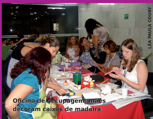
Oficina de decupagem: mães decoram caixas de madeira