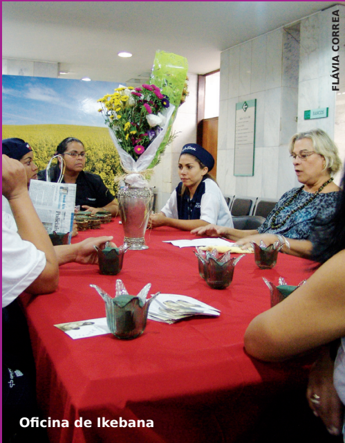
Oficina de Ikebana