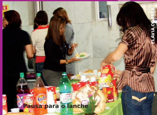
Pausa para o lanche