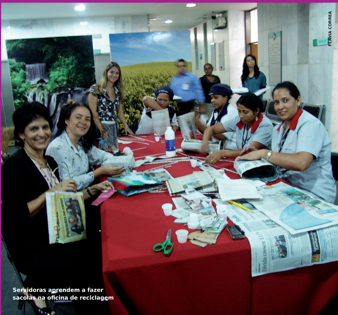
Servidoras aprendem a fazer sacolas na oficina de reciclagem