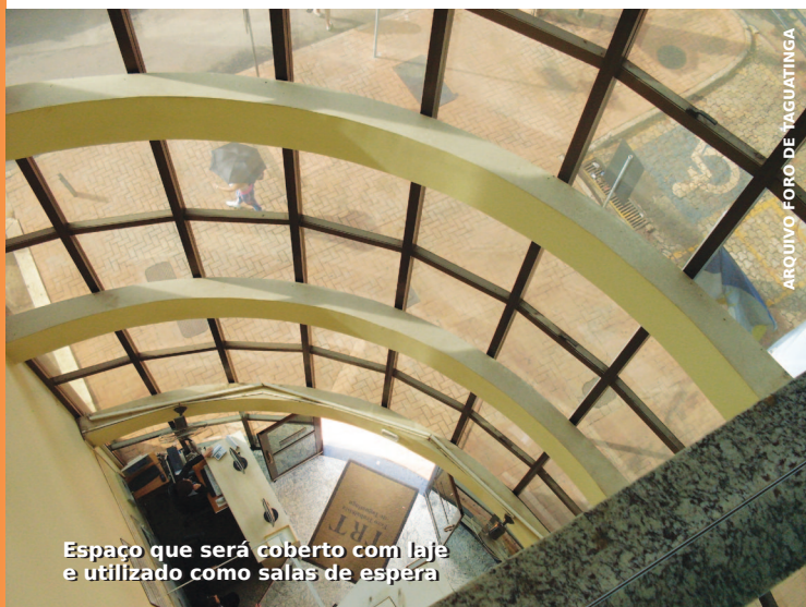
Espaço que será coberto com laje e utilizado como salas de espera