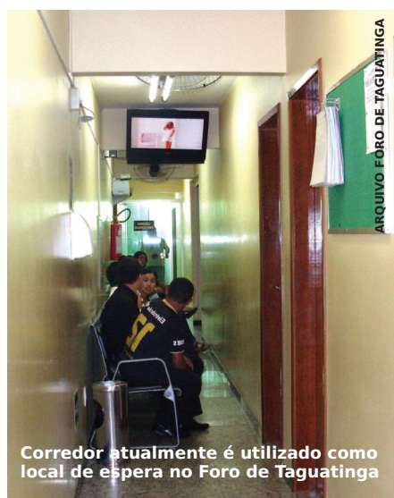
Corredor atualmente é utilizado como local de espera no Foro de Taguatinga

Desde o início de abril o prédio em que ficam as Varas Trabalhistas de Taguatinga passa por uma pequena reforma. Apesar de atender bem às necessidades dos magistrados, servidores e jurisdicionados, o prédio não tem um local adequado para espera de atendimento. Atualmente, o público aguarda as audiências nos corredores. Por isso, a solução para melhor atender o público foi fechar o vão do hall de entrada, ou seja, o espaço vertical da entrada do prédio, que fica ao lado do elevador, passará a ser fechado nos três pavimentos e estes locais ficarão reservados às salas de espera do Foro.