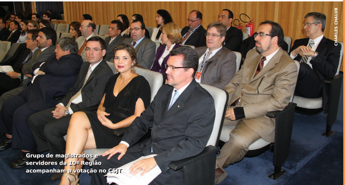
Grupo de magistrados e servidores da 10ª Região acompanham a votação no CSJT