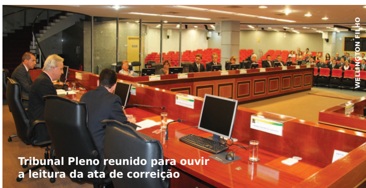
Tribunal Pleno reunido para ouvir a leitura da ata de correição