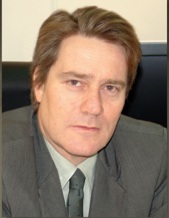
Desembargador Mário Caron despede-se da Presidência