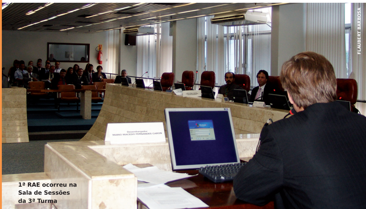
1ª RAE ocorreu na Sala de Sessões da 3ª Turma