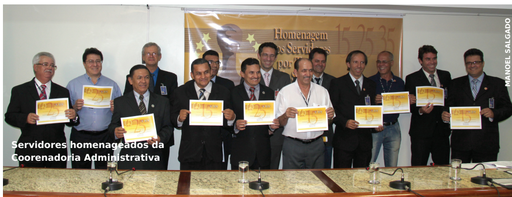
Servidores homenageados da Coordenadoria Administrativa