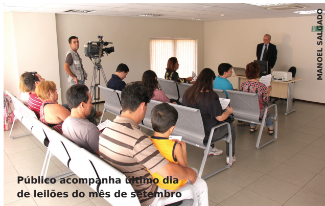
Público acompanha último dia de leilões do mês de setembro