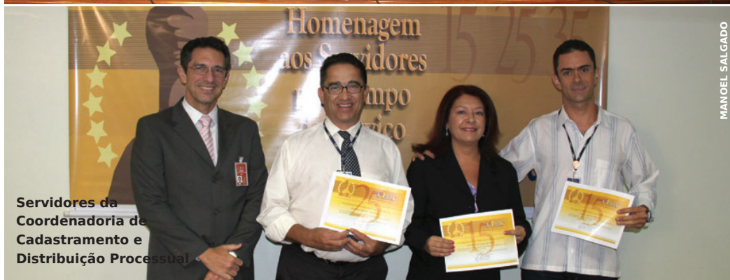
Servidores da Coordenadoria de Cadastramento e Distribuição Processual