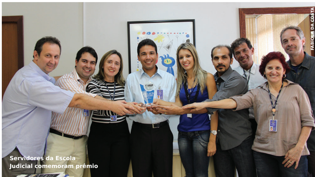
Servidores da Escola Judicial comemoram prêmio