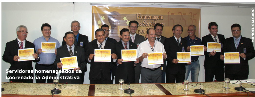
Servidores homenageados da Coordenadoria Administrativa