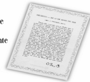
Replica do Decreto de 13 de maio de 1808.

...a Imprensa Nacional foi criada através do Decreto de 13 de maio de 1808, assinado pelo Príncipe Regente D. João, com o nome de Impressão Régia e seu objetivo era o de imprimir, com exclusividade, todos os atos normativos e administrativos oficiais do governo?