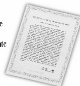
Replica do Decreto de 13 de maio de 1808.

...a Imprensa Nacional foi criada através do Decreto de 13 de maio de 1808, assinado pelo Príncipe Regente D. João, com o nome de Imprensa Régia e seu objetivo era o de imprimir, com exclusividade, todos os atos normativos e administrativos oficiais do governo?