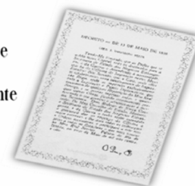
Replica do Decreto de 13 de maio de 1808.

...a Imprensa Nacional foi criada através do Decreto de 13 de maio de 1808, assinado pelo Príncipe Regente D. João, com o nome de Impressão Régia e seu objetivo era o de imprimir, com exclusividade, todos os atos normativos e administrativos oficiais do governo?