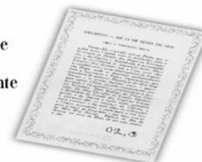
Replicação do Decreto de 13 de maio de 1808.

...a Imprensa Nacional foi criada através do Decreto de 13 de maio de 1808, assinado pelo Príncipe Regente D. João, com o nome de Impressão Régia e seu objetivo era o de imprimir, com exclusividade, todos os atos normativos e administrativos oficiais do governo?