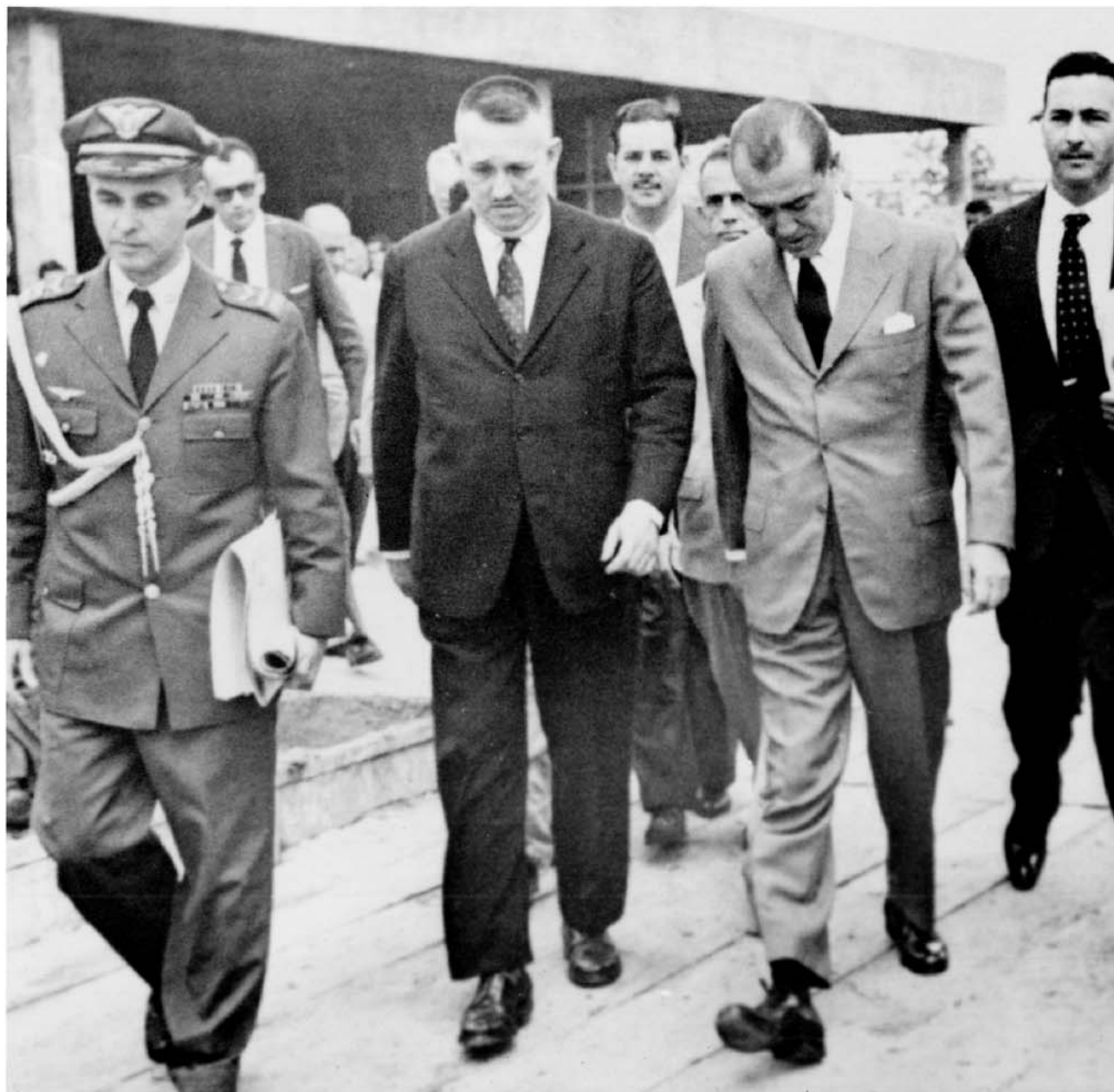
Visita do Presidente Juscelino Kubitschek às obras de construção da sede da Imprensa Nacional no Setor de Indústrias Gráficas - Brasília, em 1960