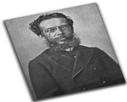
O autor de "Dom Casmurro", "Quincas Borba", entre outras obras, é patrono in memoriam da Imprensa Nacional desde janeiro de 1997.